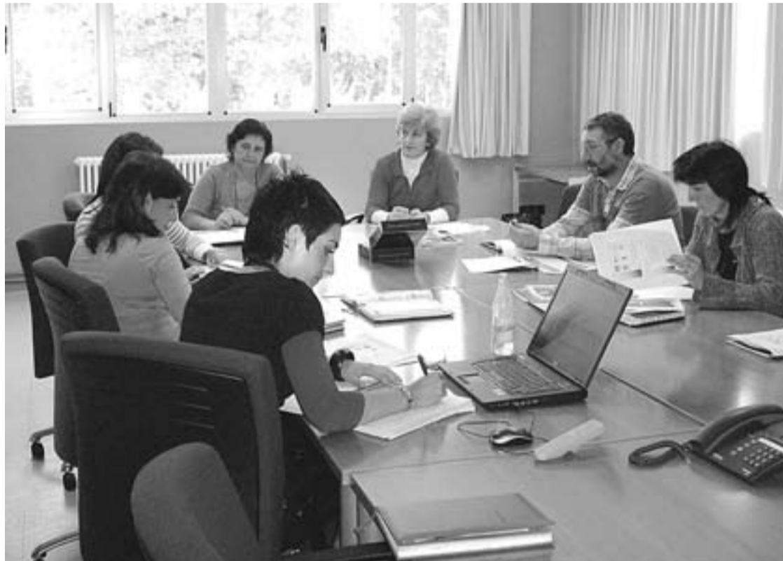
Ikastetxeen mahaiak egin dituen batzarretako baten irudian, ikastetxeetako eta Azaro Fundazioako ordezkariak.

► Eskualdean egon daitezkeen negozio aukerak detektatzeko helburuagaz, inguruko adituekin harre-