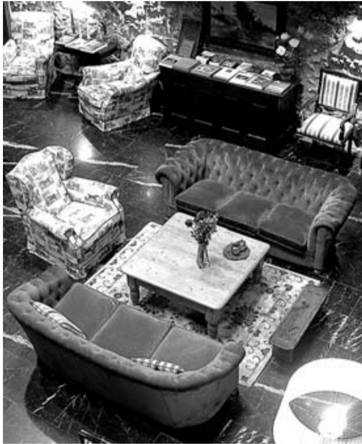
Espazio zabalek eta ondo zaindutako detaileek osatzen dute baserriaren barneko alde.

Ansotegi nekazal hotelak lasaitasunez egoteko gune eroso, atsegin eta lagunartekoa eskaintzen du